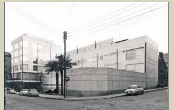
Vista del Laboratori des del xamfrà amb el carrer Ripollès "Fundació Uriach 1838"